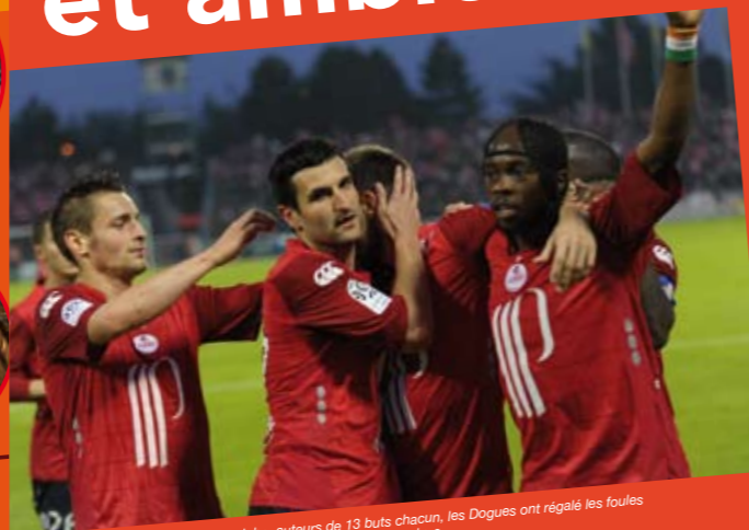
A l'image de Frau, Cabaye ou Gervinho, auteurs de 13 buts chacun, les Dogues ont régalé les foules en 2009-2010, inscrivant 105 buts toutes compétitions confondues.

Le LOSC : un acteur majeur du football français Né en 1944, le LOSC s'est rapidement imposé comme l'un des plus grands clubs français de l'après-guerre, remportant notamment deux titres de champion de France et 5 coupes de France.