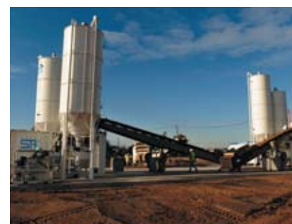
Centrale de fabrication de coulis

combler ces cavités parfois profondes d'une quinzaine de mètres. Ce n'est qu'après l'arasement de la butte faite de matériaux de déconstruction – soit plus de 350 000 m 3 à évacuer – et la dépollution des sols que les travaux préparatoires seront terminés. » Un chantier qui se veut propre et transparent à l'égard des riverains. Des « lave-roues » automatiques, des contrôles de la pollution de l'air, l'arrosage des pistes ne sont que quelques exemples des mesures prises pour respecter ces engagements.