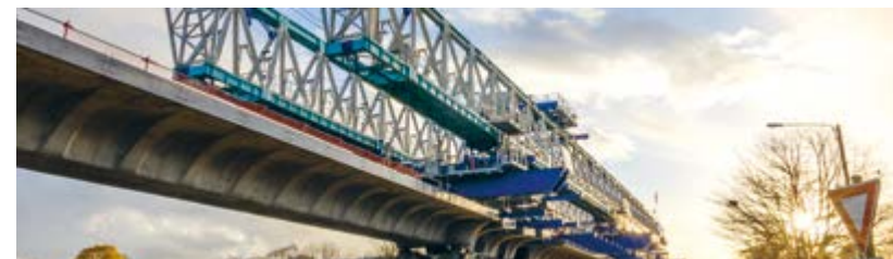
Métro de Rennes (Ille-et-Vilaine) — En septembre 2017, plus de la moitié des tabliers du viaduc étaient déjà construits, soit plus de 1 200 m.

En qualité de constructeur et de gestionnaire d'infrastructures, nous sommes l'un des acteurs essentiels de l'aménagement des territoires en France et dans le monde. Routes, autoroutes, tramways, métros, lignes ferroviaires, quais et écluses : grâce à la diversité de nos expertises, nous facilitons les déplacements urbains et interurbains en modernisant les infrastructures, en complétant les liaisons manquantes et en créant de nouveaux axes de communication. Nous réinventons les modalités et les moyens de transport, au service des usagers.