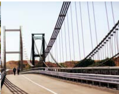
Pont de Kamoro — Madagascar