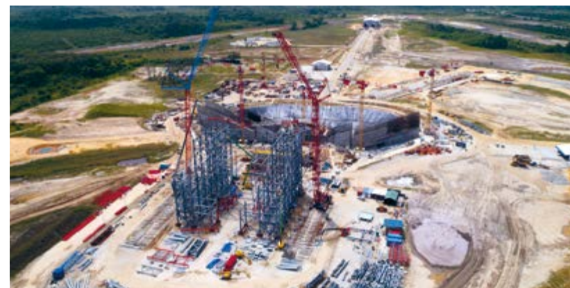
Kourou (Guyane) — Le groupe Eclair6, piloté par Eiffage, poursuit la construction des infrastructures de l'ELA4, le nouvel ensemble de lancement d'Ariane 6, pour une livraison prévue en 2018.

Aéronautique, automobile, nucléaire, pétrochimie, santé ou encore construction : nous sommes aux côtés des plus grands acteurs industriels, en France et à l'international, pour leur apporter notre savoir-faire dans la conception, l'intégration et la maintenance de systèmes industriels ainsi que dans la mise en œuvre de process de production, d'essais, de contrôle et d'analyse de conformité.