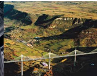
Viaduc de Millau — Aveyron