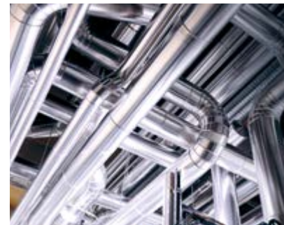
Clévia — Nouvelle marque dédiée au génie climatique et énergétique