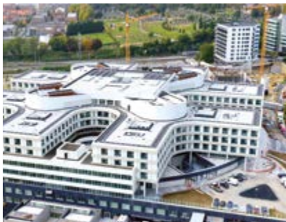
Hôpital Chirec — Auderghem (Belgique)