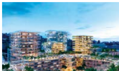
Nice (Alpes-Maritimes) — Nous apportons notre expertise aux collectivités territoriales pour concevoir leurs projets urbains de grande envergure.

Construire une ville durable, c'est garantir la capacité d'adaptation de ses quartiers aux nouveaux modes de vie et faciliter leur évolution dans le temps. C'est aussi offrir une haute qualité de vie à ses habitants grâce à des bâtiments économiques et écologiques, des réseaux fluides et partagés, des espaces de vie sécurisés et respectueux de l'environnement. Nous mobilisons toutes nos expertises pour rendre la ville plus résiliente face au dérèglement climatique, plus belle, mieux intégrée et plus adaptée à toutes les générations, actuelles et futures.