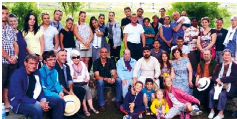
Bordeaux (France) —

Créée en 2008, la Fondation Eiffage a soutenu plus de 200 projets en neuf ans. Sa mission : contribuer à l'insertion socioprofessionnelle des personnes en difficulté. En 2018, la Fondation Eiffage met l'accent sur l'un de ses fondamentaux : l'engagement solidaire des collaborateurs du Groupe.