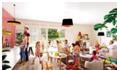
Cocoon'Ages (France) — Cet habitat intergénérationnel est à découvrir dans le showroom d'Aubagne (Bouches-du-Rhône).

Créée en 2017, Eiffage Construction Bois propose des solutions clés en main écologiques, complémentaires de la filière traditionnelle et qui apportent souplesse et réactivité.