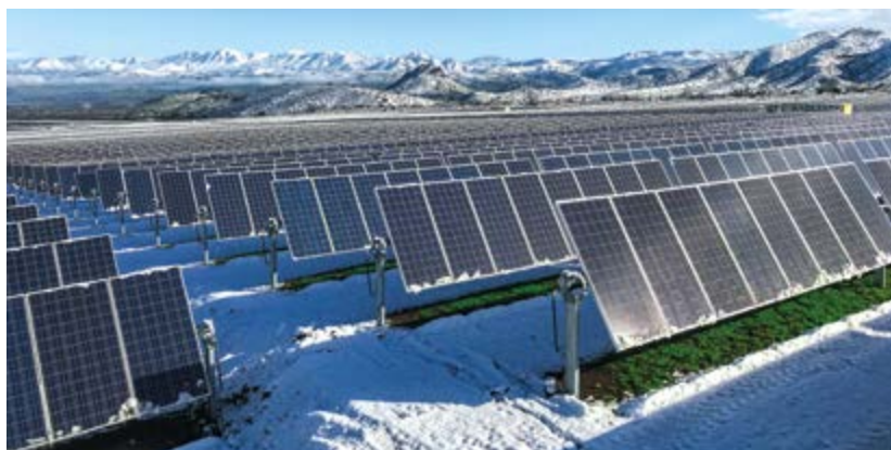
Centrale photovoltaïque, à Quilapilún (Chili) — Eiffage Énergie Systèmes, par l'intermédiaire de sa filiale espagnole Eiffage Energía, réalise les installations de cette centrale de 98 mégawatts.

Grâce à notre politique d'innovation collaborative et à nos investissements soutenus en recherche et développement, nous sommes aujourd'hui un acteur de référence de la construction bas carbone, de la route durable et des énergies renouvelables afin de répondre aux grands enjeux environnementaux du XXI e siècle.