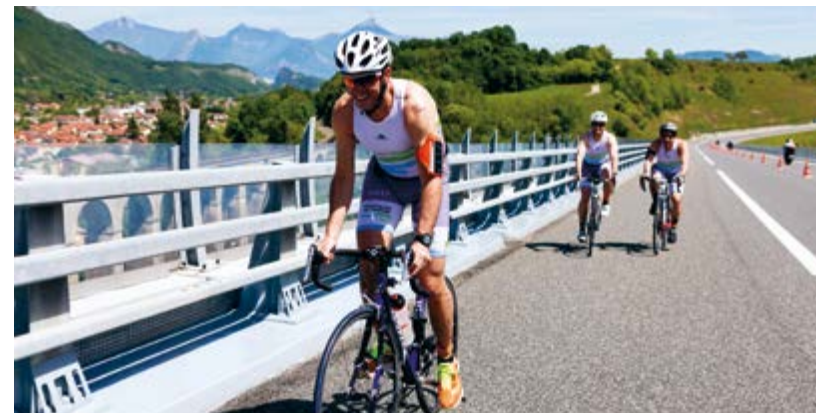
Grenoble (Isère) —

Le sport a toujours occupé une place privilégiée au sein du groupe Eiffage. Que nos collaborateurs se rassemblent spontanément pour pratiquer une discipline ou que l'impulsion soit donnée par le Groupe, le sport nous pousse vers un même objectif : relever ensemble les défis et porter haut les couleurs d'Eiffage.